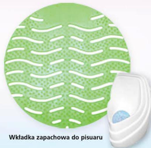
Wkładka zapachowa do pisuaru